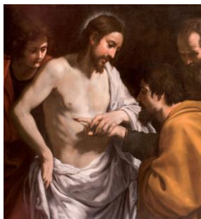
L'incrédulité de saint Thomas Giuseppe VERMIGLIO + 1635

Béati qui non vidérunt, Et firmiter credidérunt, Vítam ætérnam habébunt. Allelúia!