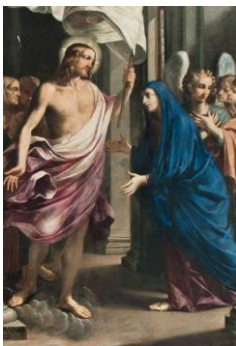
Le Christ ressuscité apparaît à sa Mère Lorenzo Pasinelli (+1700, détail)

REGINA CÆLI lætare, Allelúia! Quia quem meruísti portare, Allelúia! Resurrexít, sicut díxít, Allelúia! Ora pro nóbis Déum, Allelúia!