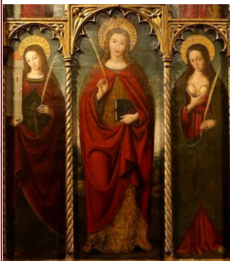
Sainte Dévote, entre sainte Barbe et sainte Agathe, par Ludovico Brea +1525 (église de Dolceacqua, Italie)

Sciamano in Cielo i Santi, Fan coro, giubilanti Gli Angeli del Signore ; Laude eterna a te si canti, O pudica Verginella, D'ogni grazia adorna, e bella Di divina Santità Di Cristo sei sposa, E martir gloriosa ! Sù canti, festosa, La Corsica encor ; Ah ! Gloria più santa Di Cirno non vanta Il patrio valor !