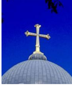
La Croix en or de la coupole de la Basilique du Saint-Sépulcre

L'évêque du lieu et de l'époque était saint Cyrille, Père de l'Église et déclaré Docteur de l'Église en 1893 par le Pape Léon XIII, en raison de ses fameuses Catéchèses mystagogiques prononcées devant un peuple nombreux et enthousiaste en la Basilique du Saint-Sépulcre. Né à Jérusalem vers 315, il fut ordonné diacre en 335 par saint Macaire, évêque de Jérusalem et premier témoin du recouvrement, vers 330, de la vraie Croix du Christ par sainte Hélène, mère de vers 345 par l'évêque caire, il lui succéda vers 350, jusqu'à sa mort en 387. Dans chanceler l'Église au IV e défenseur de la doctrine catar de saint Athanase à à Poitiers. Le début de l'épiscopat par l'apparition de la Croix salem, le 7 mai 351: il en fut